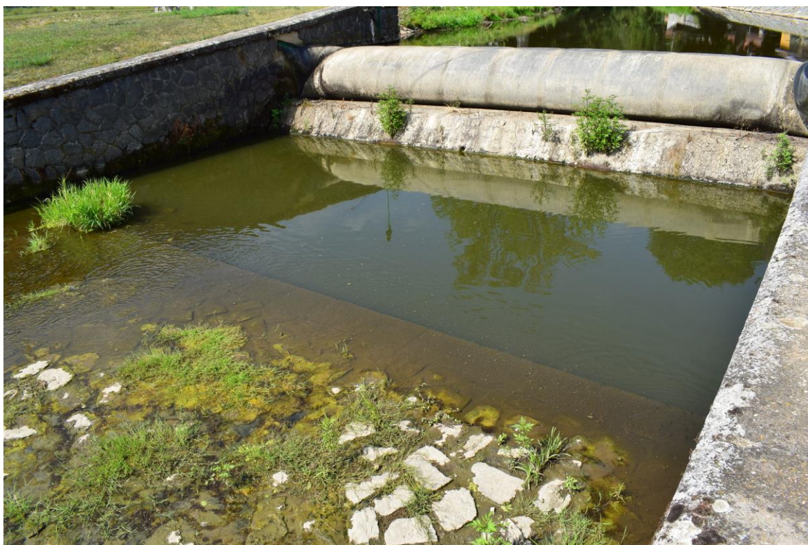
ř.km 11,424 – 11,440 úsek pod vakovým jezem (pohled proti vodě)