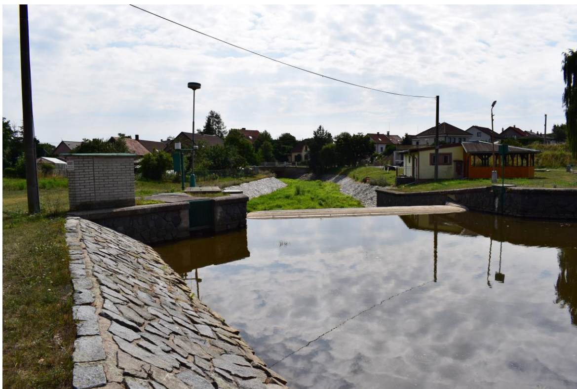
ř.km 11,440 očištění a natření ocelových konstrukcí (pohled po vodě)