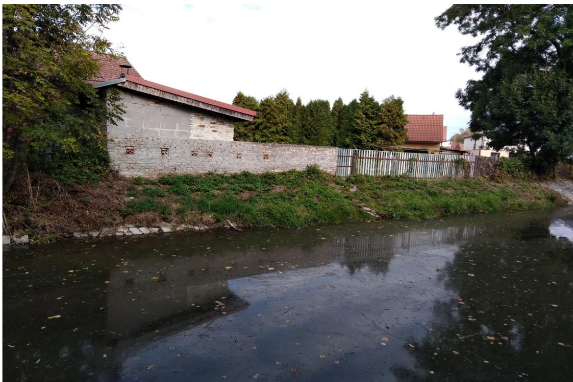
ř. km 11,490 – 11,528 odstranění drnu z dlažby LB (pohled po vodě)