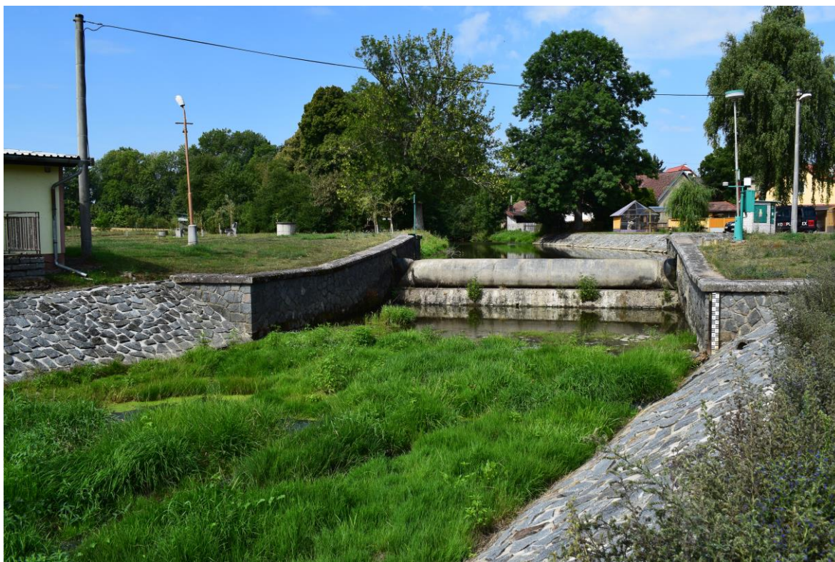
ř.km 11,410 začátek úpravy (pohled po vodě)