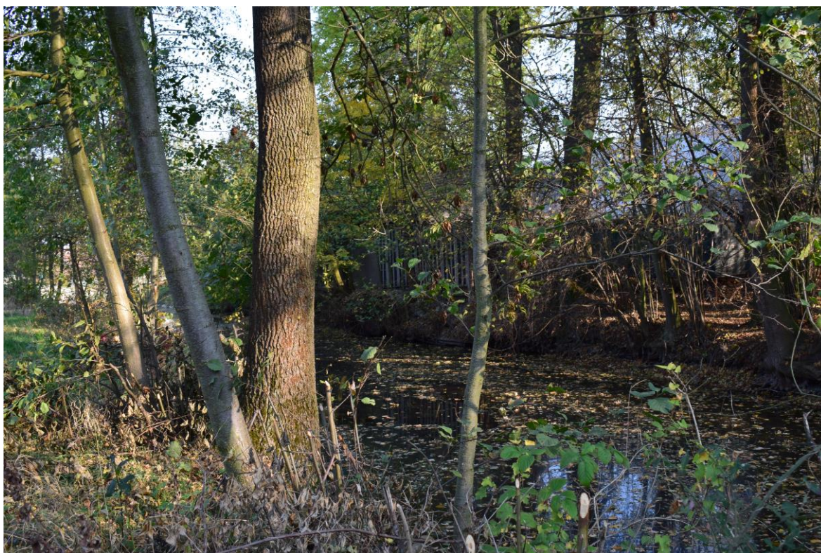
ř. km 11,570 – 11,585 odstranění stromů LB