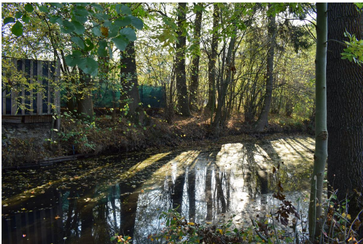
ř. km 11,560 – 11,600 odstranění dřevin z koryta vodního toku PB