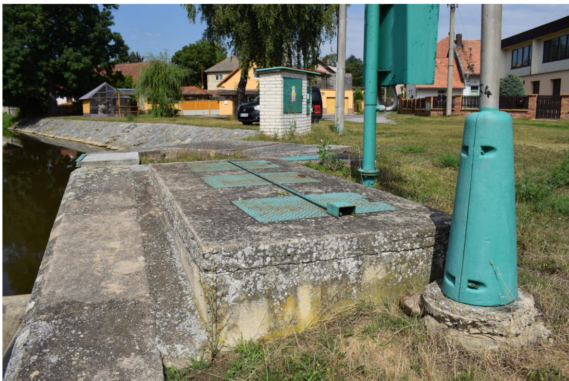
ř.km 11,440 očištění a natření ocelových konstrukcí