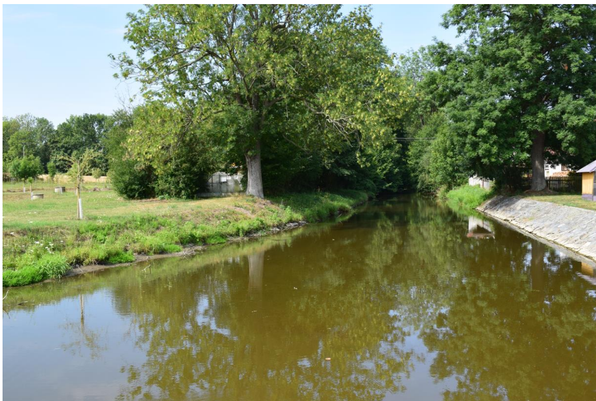
ř.km 11,446 – 11,530 odstranění drnu z dlažby PB, odstranění stromu – jasan ztepilý obv. 270 cm (pohled proti vodě)