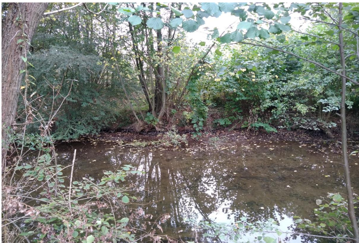
ř. km 11,560 – 11,600 odstranění dřevin z koryta vodního toku PB