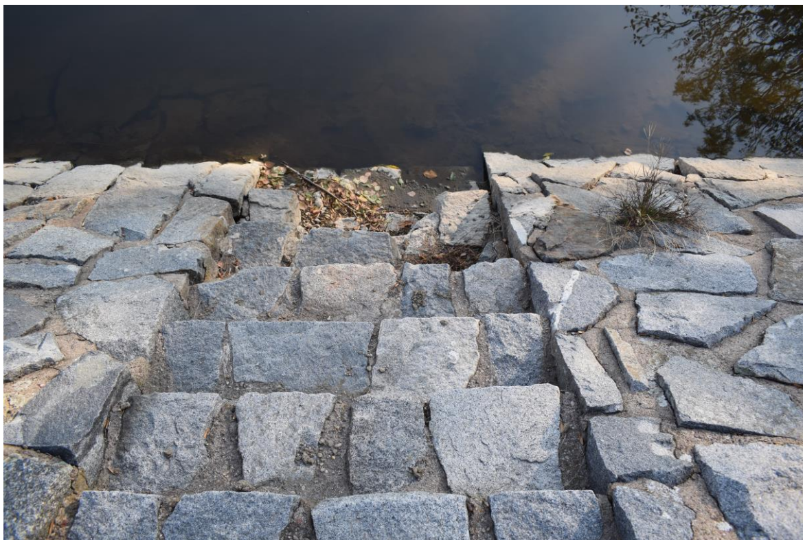
ř. km 11,460 a 11,480 oprava schodišťového stupně